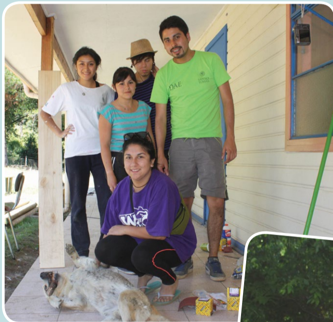
Los jóvenes pintaron colegios de la zona.