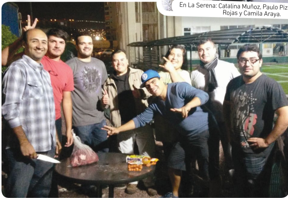
Estudiantes de Ingeniería en Informática de Iquique.