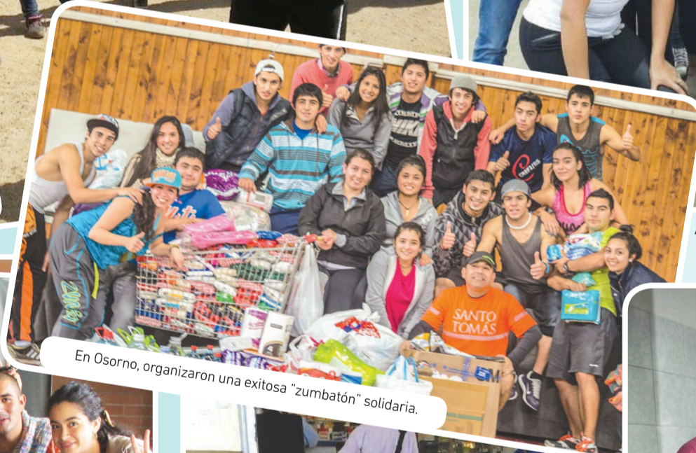
En Osorno, organizaron una exitosa "zumbatón" solidaria.