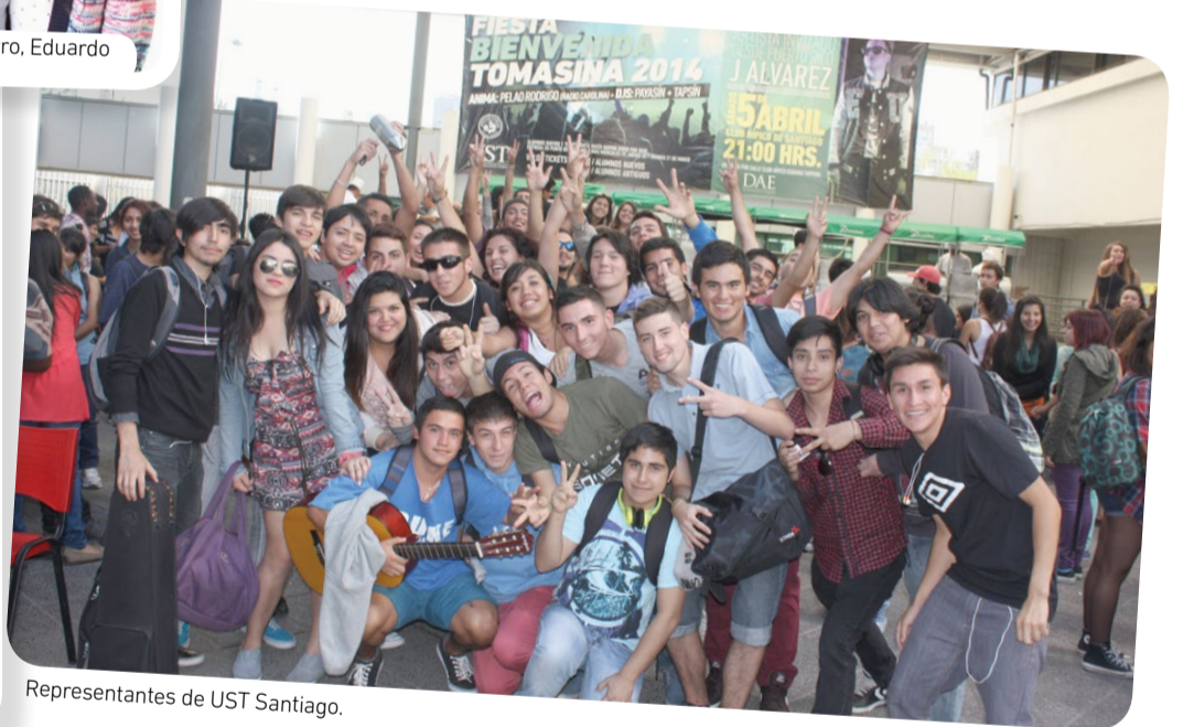
Representantes de UST Santiago.