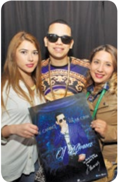
Alumnas de Santiago junto al artista invitado, el reggaetonero J Álvarez.

En diversas sedes, los estudiantes recibieron con gran ánimo este nuevo año académico.