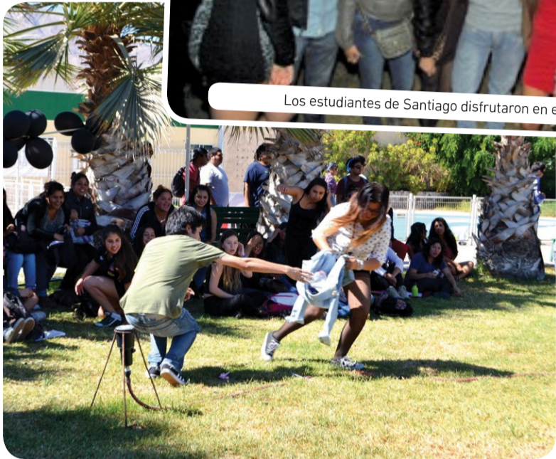
En Copiapó organizaron entretenidos concursos.