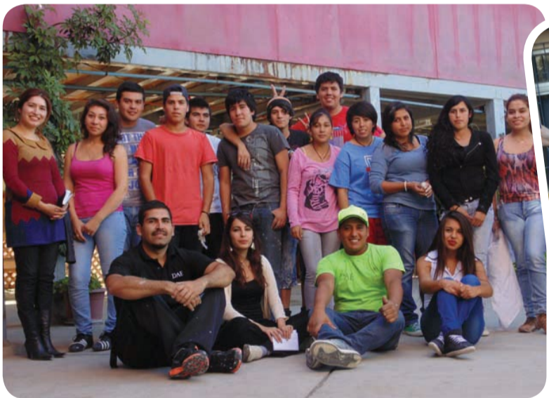
Alumnos de Ovalle durante el "mechoneo solidario".