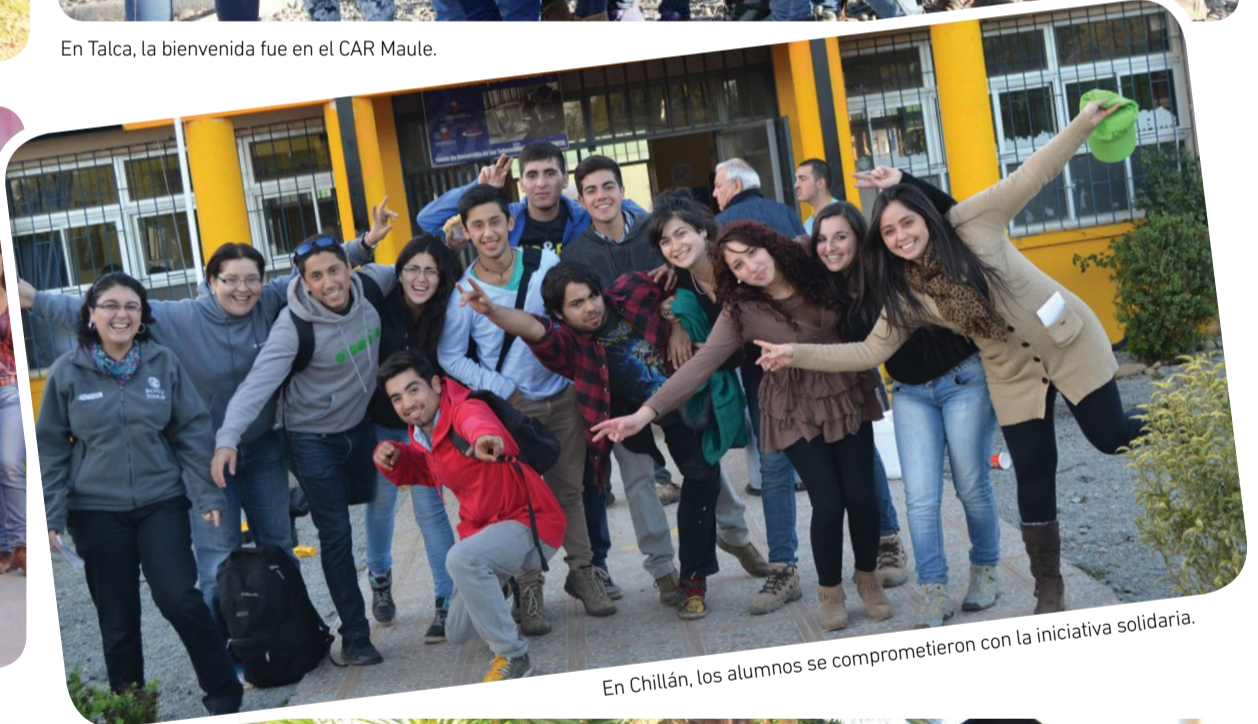
En Chillán, los alumnos se comprometieron con la iniciativa solidaria.