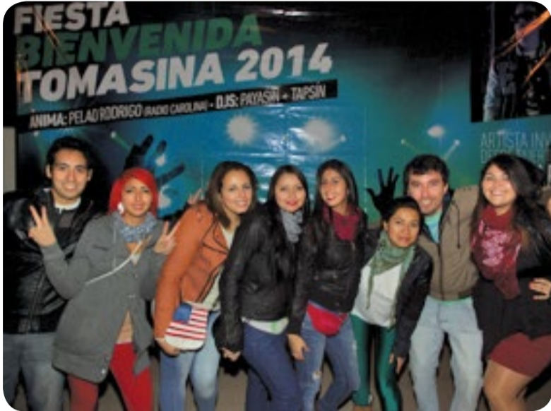
Los jóvenes de Santiago compartieron animadamente.