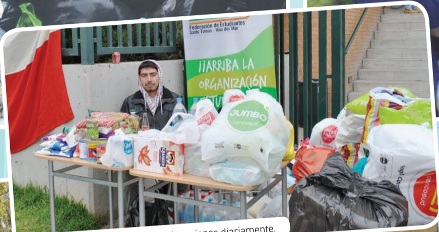
En Viña del Mar recolectaron donaciones diariamente.