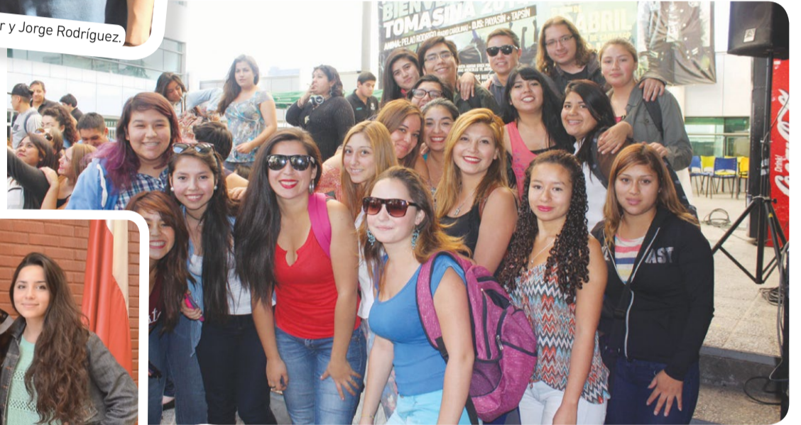
Alumnos de UST Santiago.