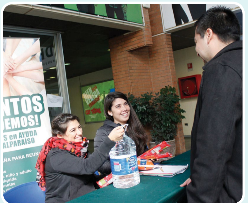
En Talca, los alumnos recibieron agua y alimentos no perecibles.