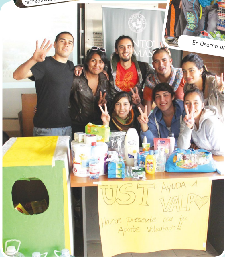
La Serena también hizo su aporte para Valparaíso.