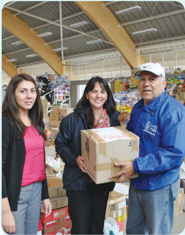
Santo Tomás Viña del Mar canalizó toda su ayuda hacia los centros de acopio.