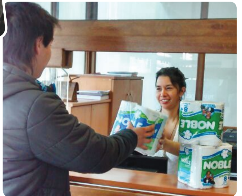
En Punta Arenas también recibieron donaciones.