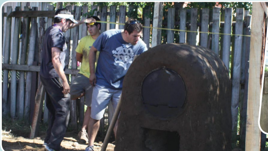
Los estudiantes construyeron hornos de barro.