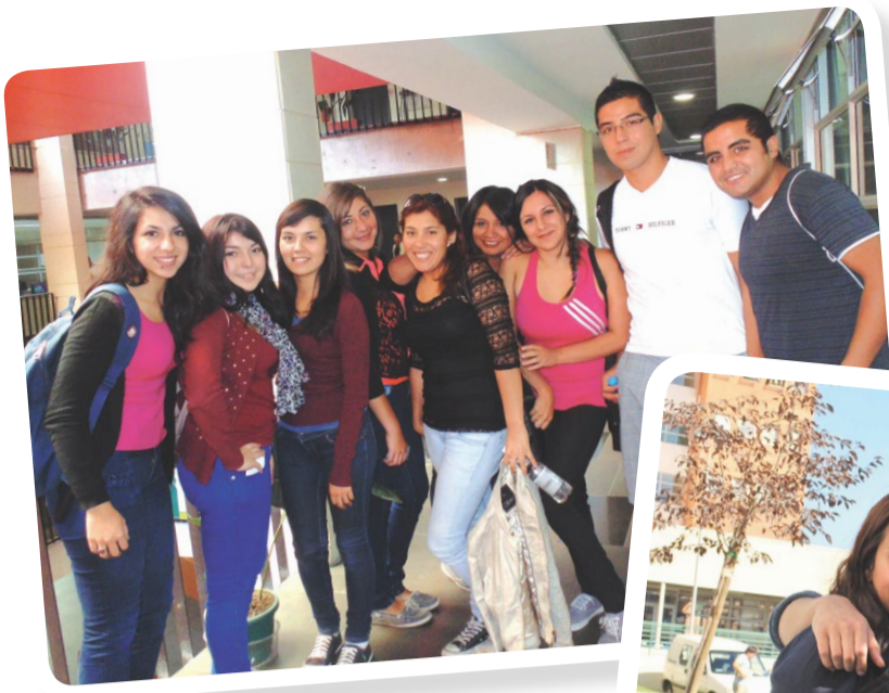
Alumnos de IP-CFT Santiago Centro.