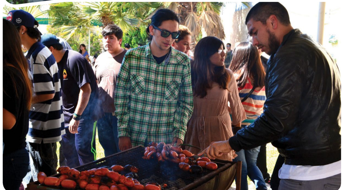
En Copiapó, compartieron con choripanes.