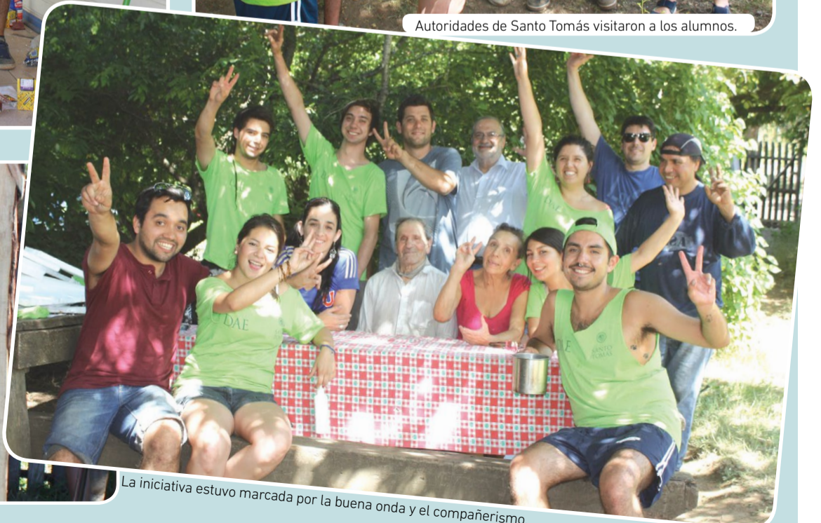
La iniciativa estuvo marcada por la buena onda y el compañerismo.