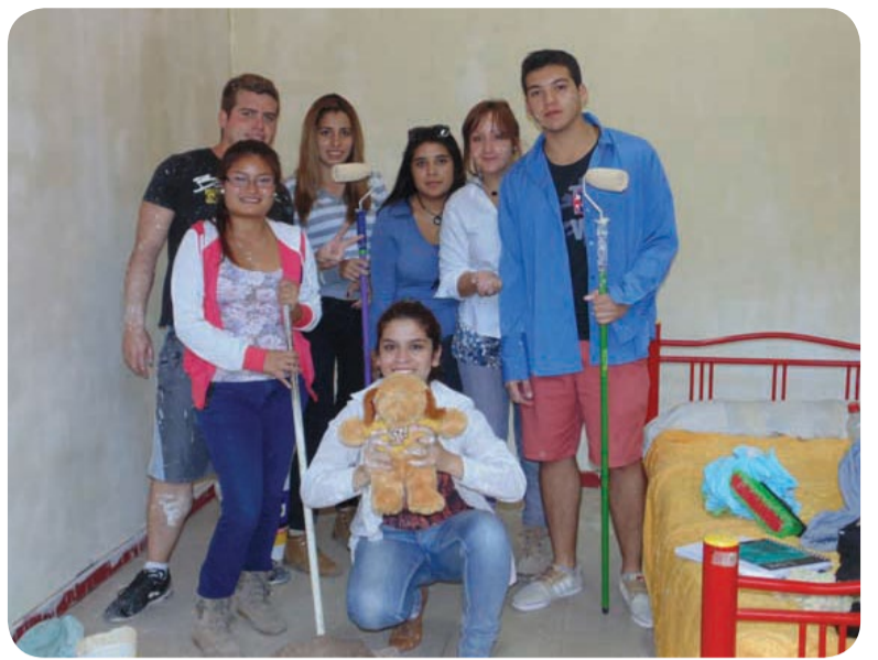
En Ovalle, los jóvenes trabajaron en mejorar la hospedería del Hogar de Cristo.