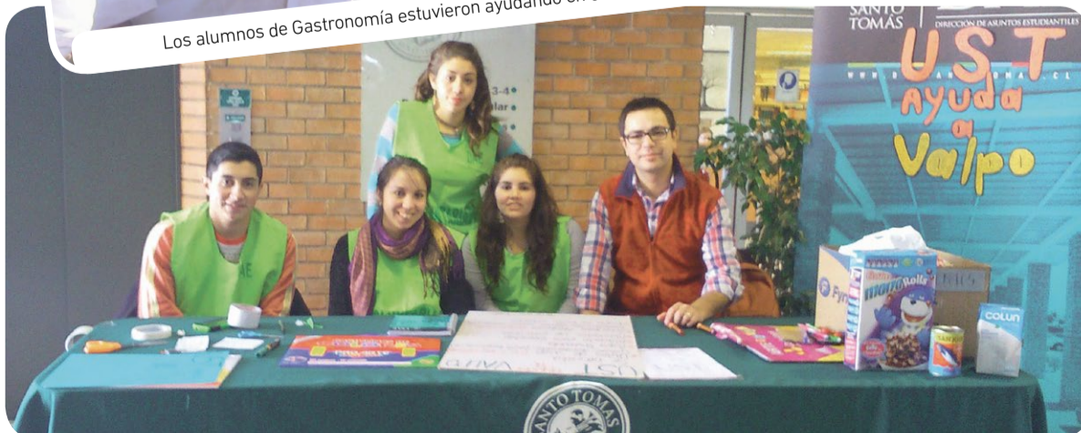
En Concepción instalaron rápidamente un stand para iniciar la campaña.