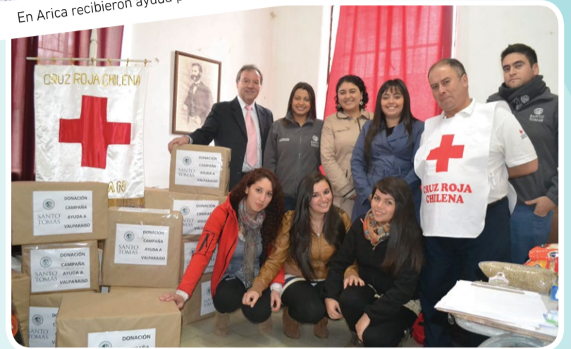
En Chillán, la iniciativa tuvo una gran adhesión.