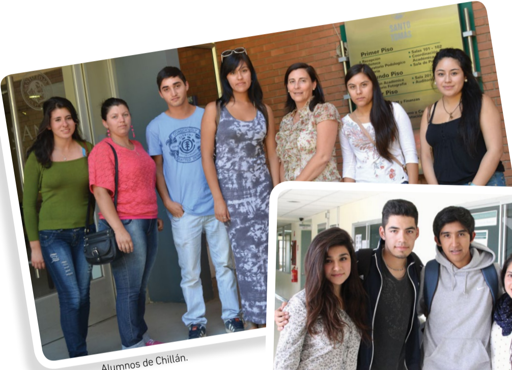
Alumnos de Chillán.