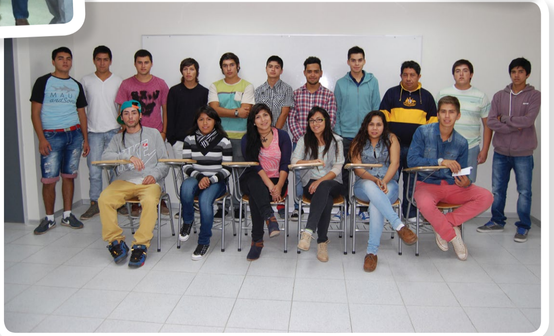
Alumnos de Topografía de Viña del Mar.