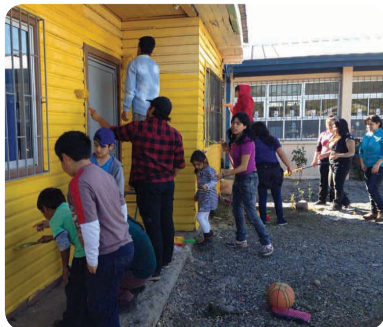
En Chillán, los estudiantes pintaron la escuela Paul Harris con la ayuda de los niños.