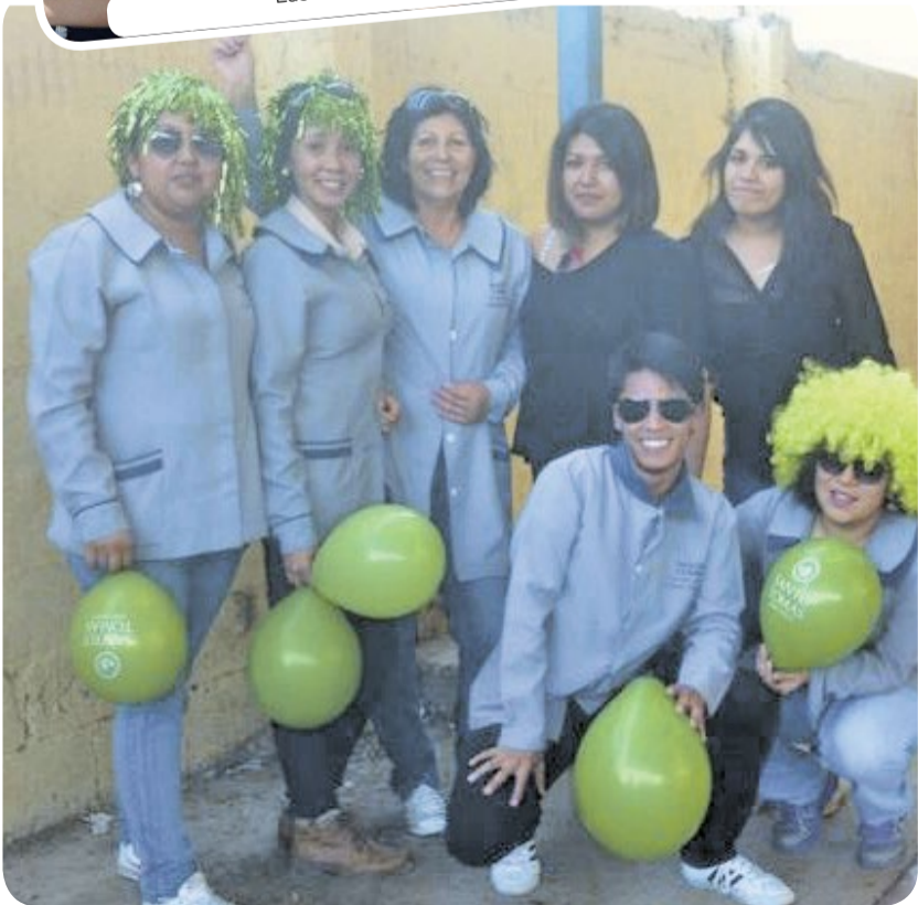
En Ovalle, los jóvenes también participaron en las alianzas.