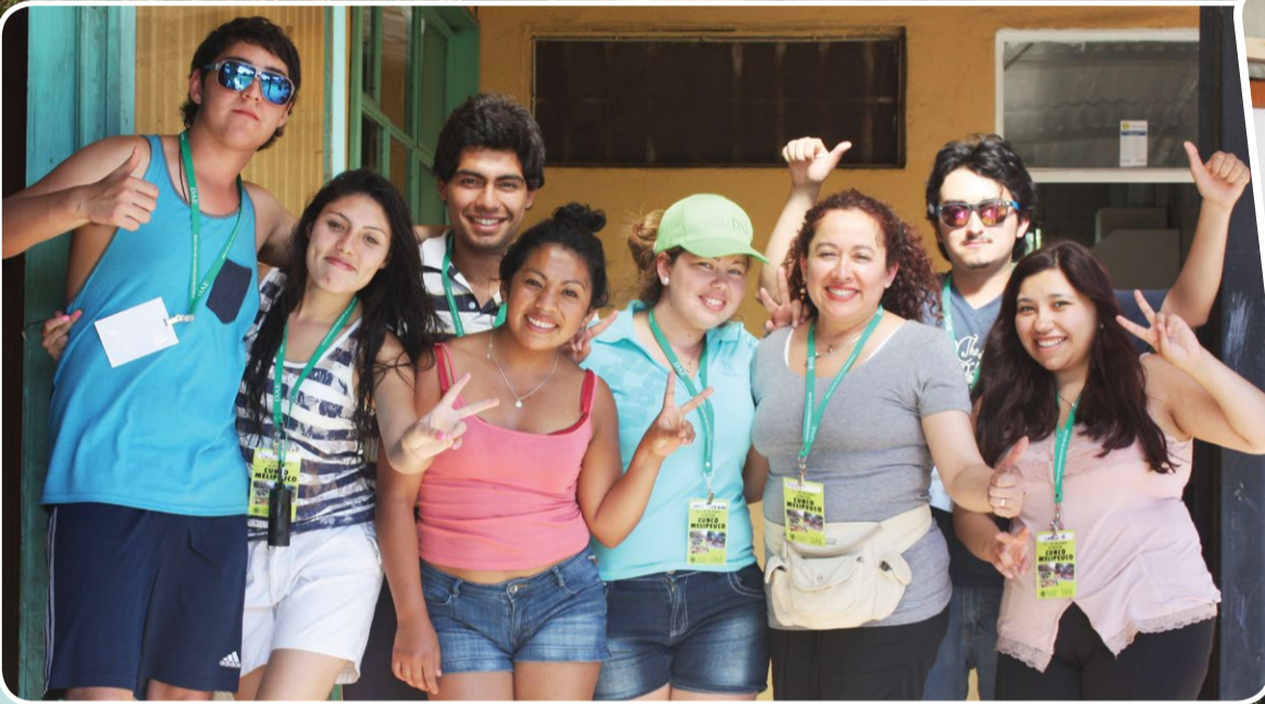
Más de 200 alumnos participaron en la actividad solidaria.

Los alumnos también compartieron con los niños.