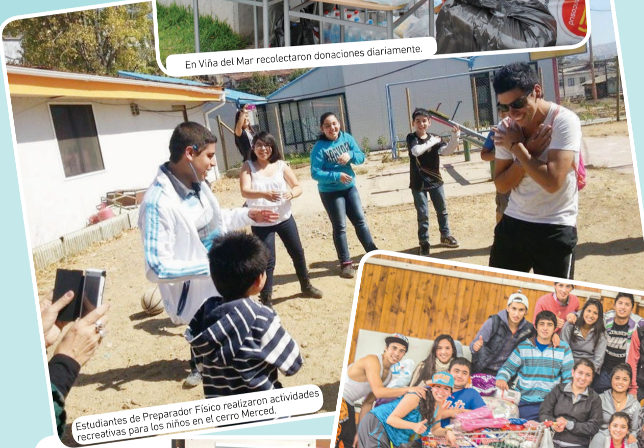
Estudiantes de Preparador Físico realizaron actividades recreativas para los niños en el cerro Merced.