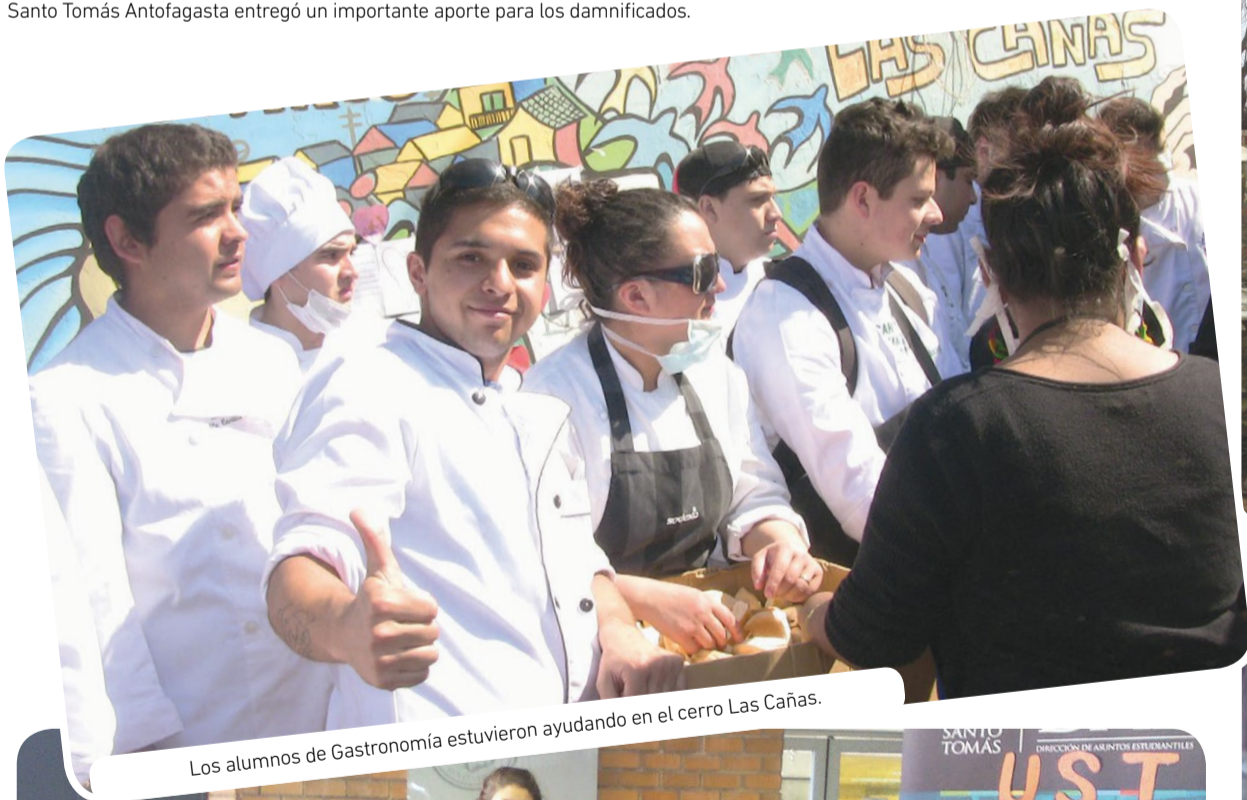
Los alumnos de Gastronomía estuvieron ayudando en el cerro Las Cañas.