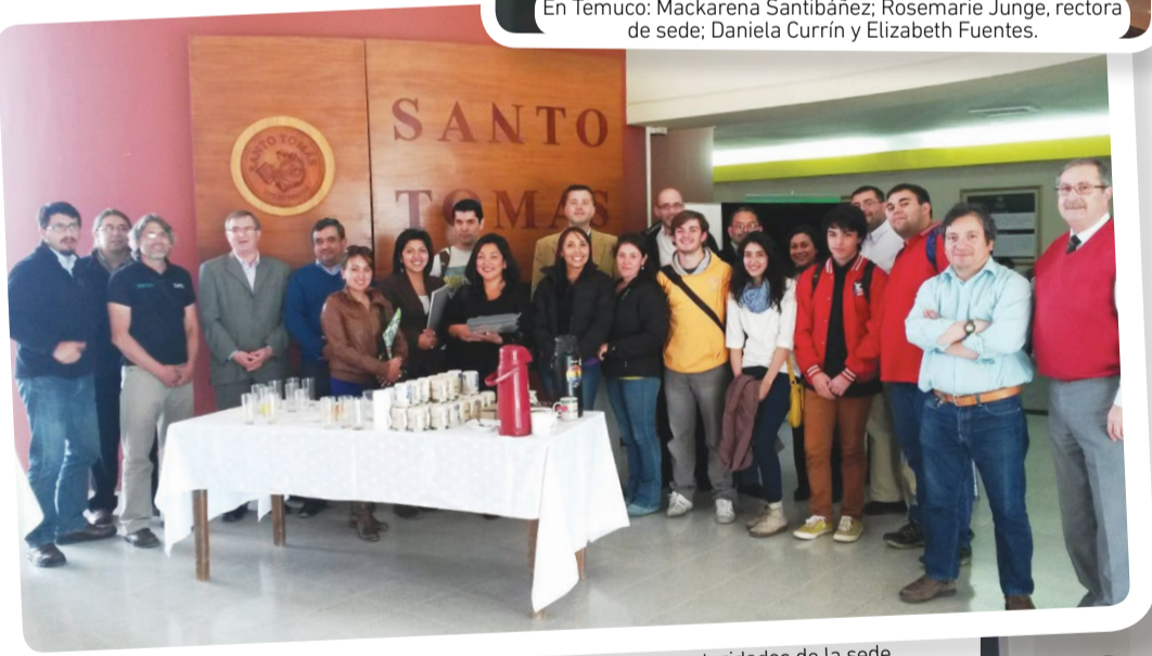
En Puerto Montt, alumnos y autoridades de la sede.