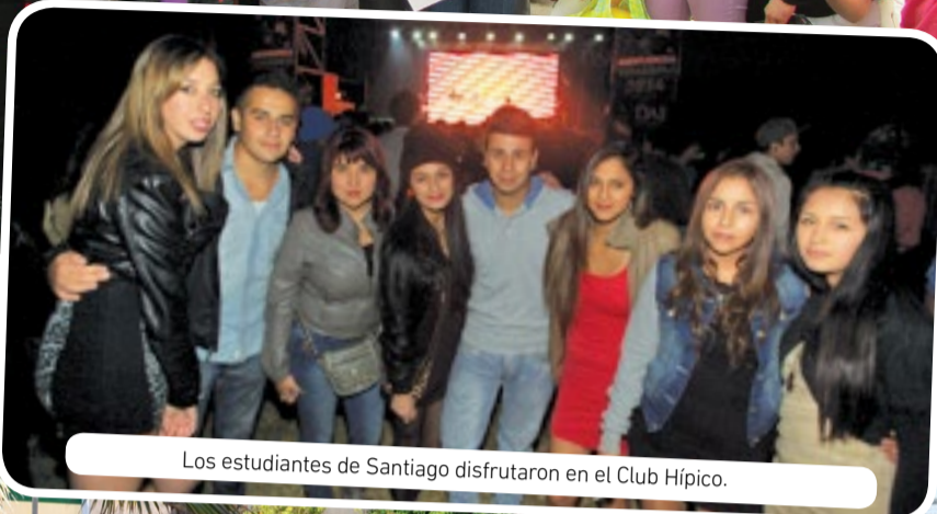
Los estudiantes de Santiago disfrutaron en el Club Hípico.