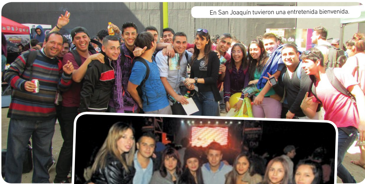
En San Joaquín tuvieron una entretenida bienvenida.