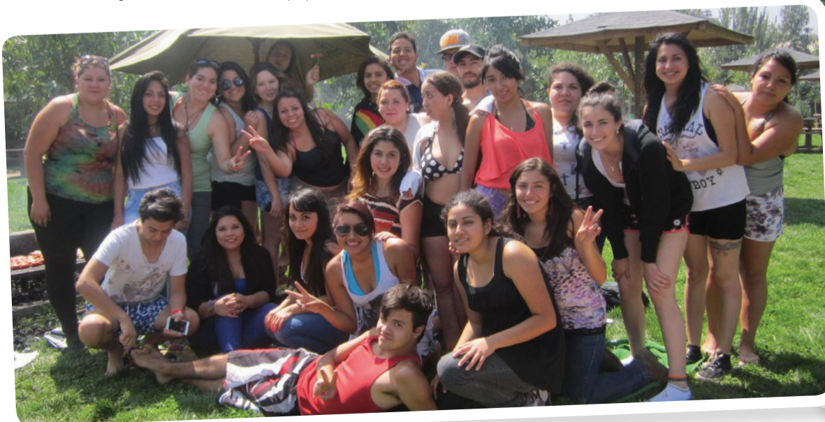
En Puente Alto, participaron en un "mechoneo sano".