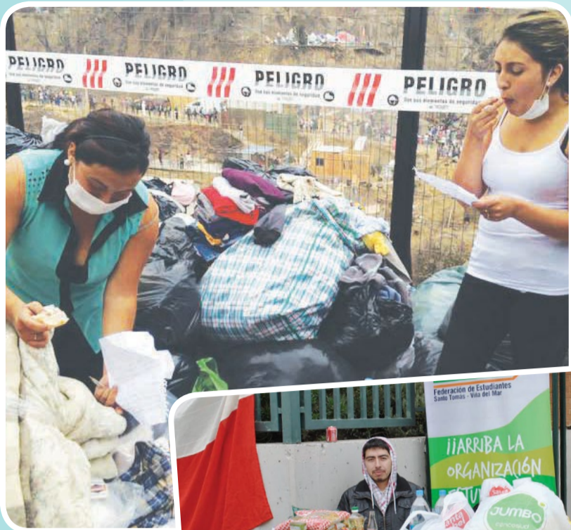
Las jóvenes clasificaron la ropa donada.