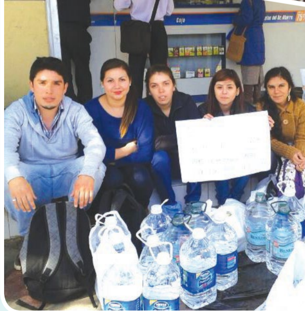
Alumnos de la Escuela de Educación de Viña del Mar recolectaron ayuda para el cerro Ramaditas.