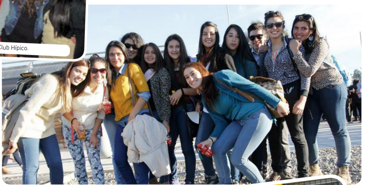
En Talca, la bienvenida fue en el CAR Maule.