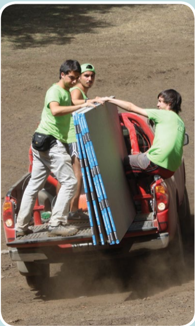
El trabajo fue "a todo terreno".