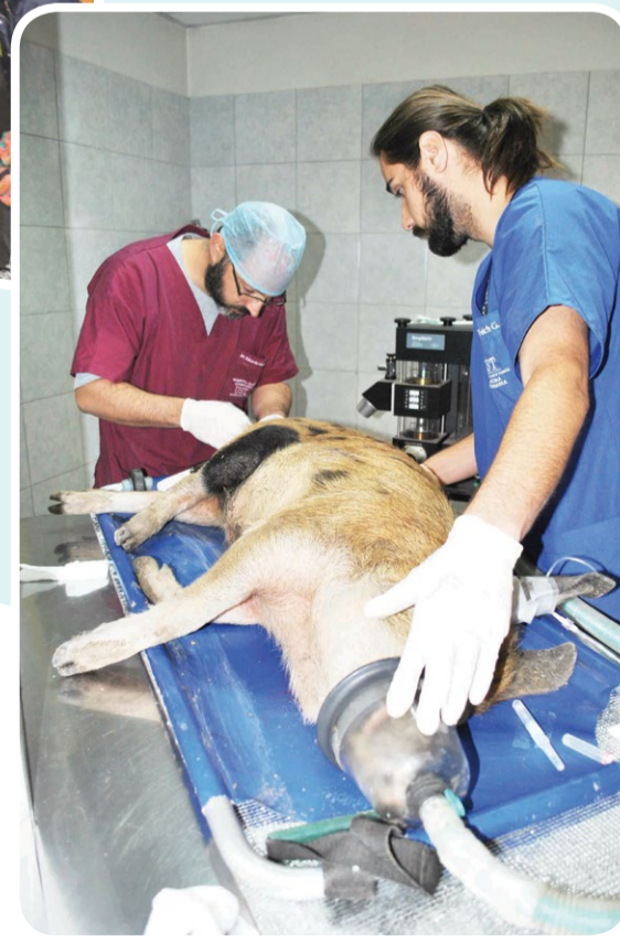
La Clínica Veterinaria de la UST Viña del Mar atendió a más de 100 animales afectados por el incendio.