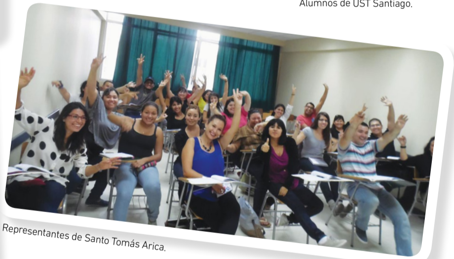
Representantes de Santo Tomás Arica.