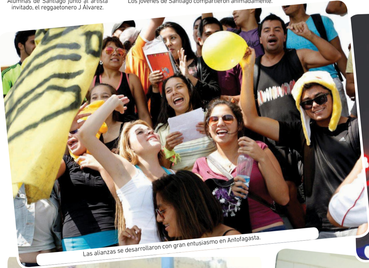
Las alianzas se desarrollaron con gran entusiasmo en Antofagasta.