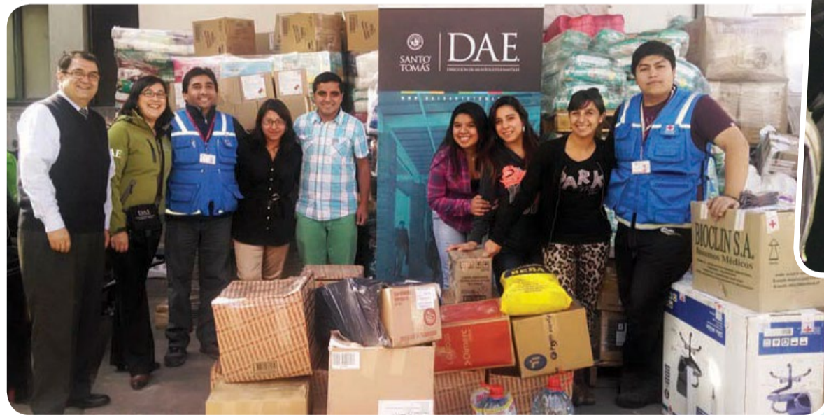
Santo Tomás Santiago Centro realizó un gran aporte para los damnificados.