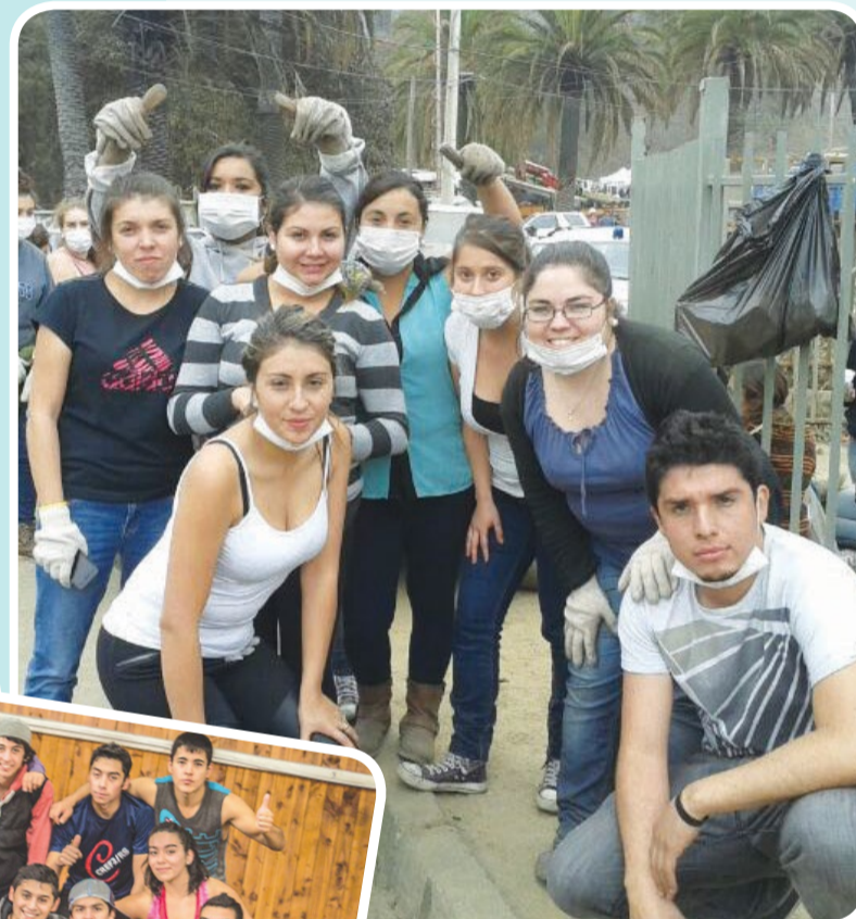
Alumnos de la Escuela de Educación en Valparaíso.