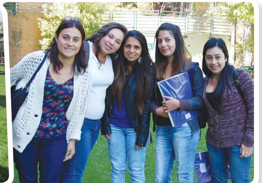
Alumnas de Tecnología Médica de Viña del Mar.