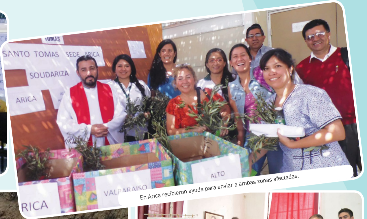
En Arica recibieron ayuda para enviar a ambas zonas afectadas.