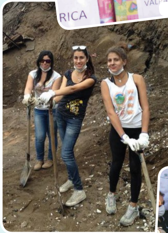
Las alumnas de Fonoaudiología removieron escombros en los cerros.