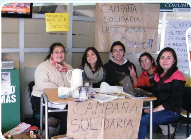
Gran éxito tuvo la campaña en Puerto Montt.