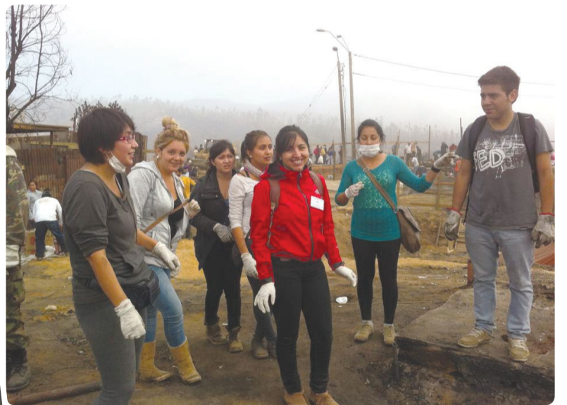
Voluntarios de la Escuela de Administración y Contabilidad de Viña del Mar.