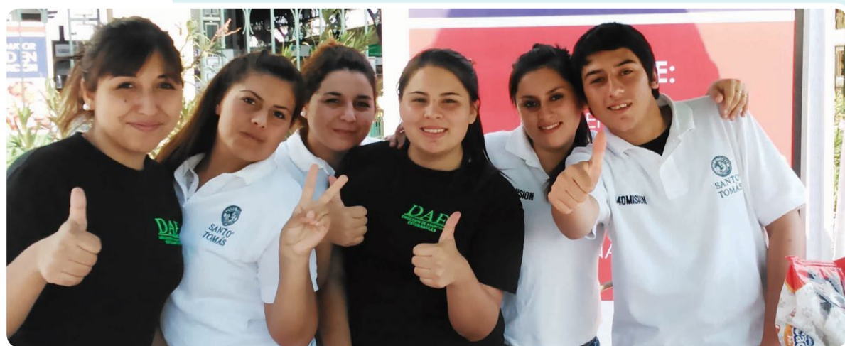
En IP-CFT Estación Central también se hicieron presentes.