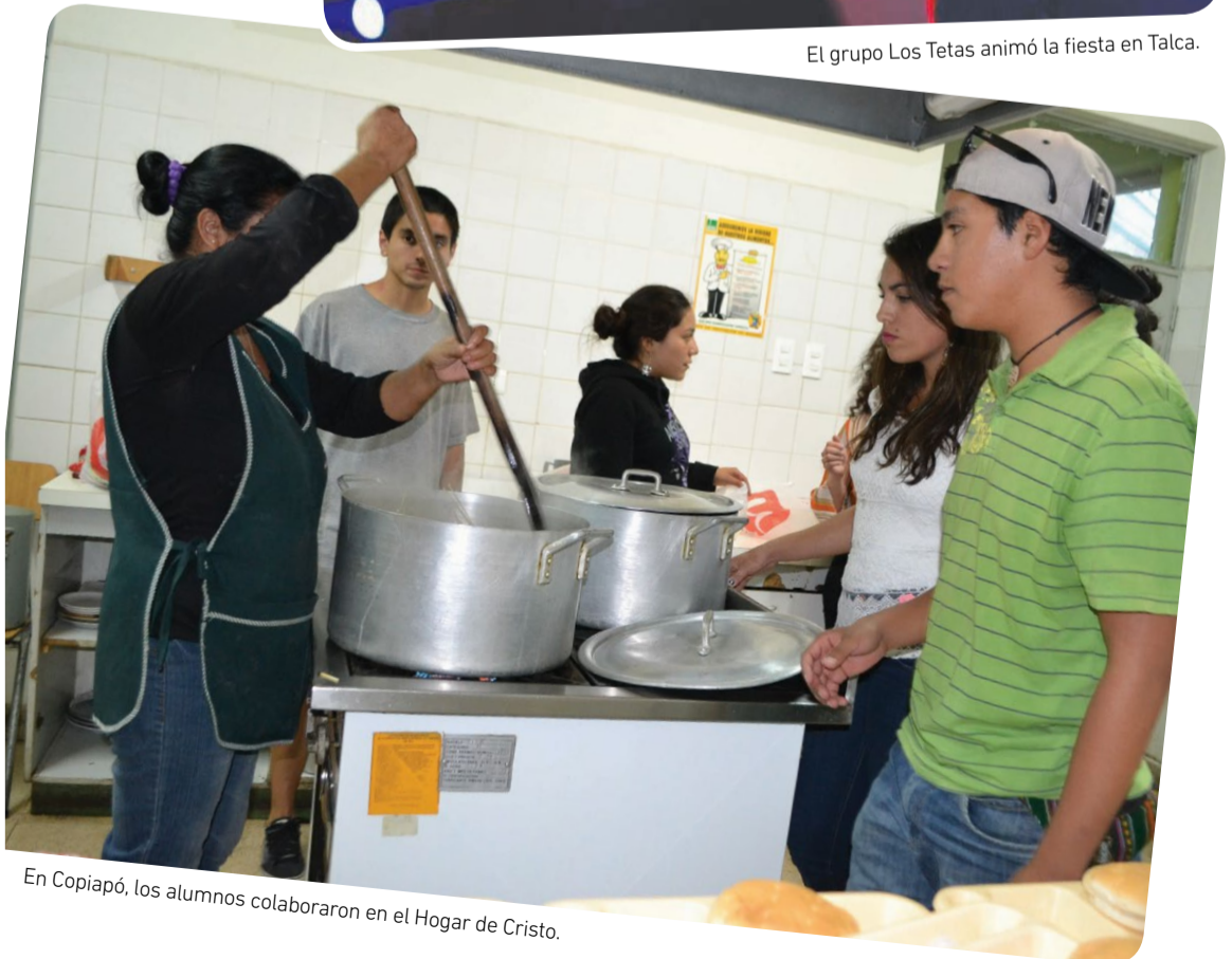
En Copiapó, los alumnos colaboraron en el Hogar de Cristo.