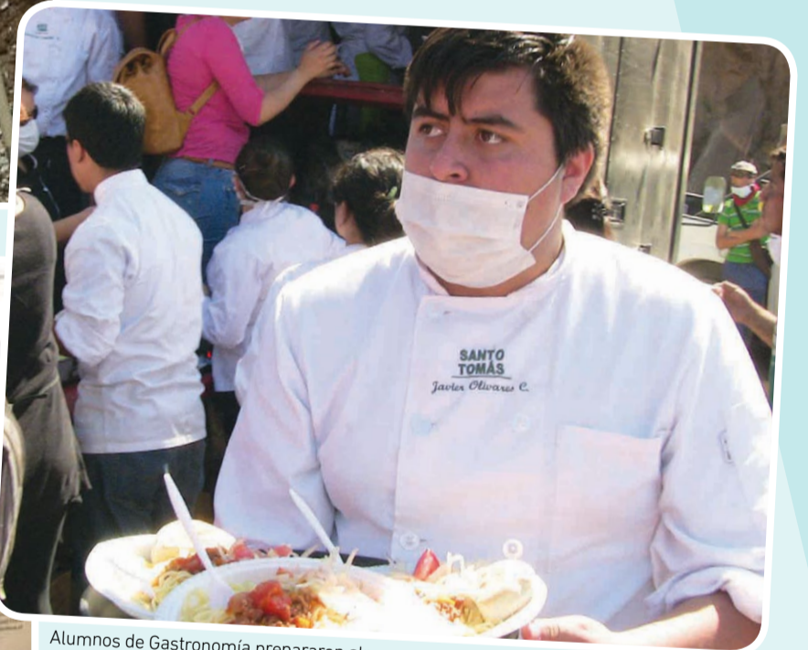
Alumnos de Gastronomía prepararon almuerzos para 200 personas.