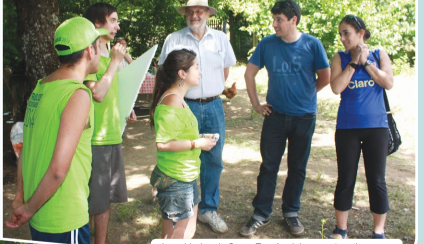
Autoridades de Santo Tomás visitaron a los alumnos.