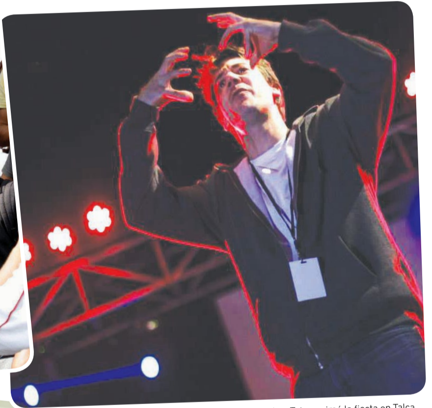
El grupo Los Tetas animó la fiesta en Talca.