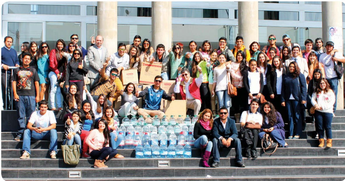
Santo Tomás Antofagasta entregó un importante aporte para los damnificados.

to Tomás Viña del Mar, quienes participaron como voluntarios en Valparaíso, apoyando en la recolección de ayuda y también en la limpieza de los distintos cerros. A ello se suma la labor del Hospital Clínico Veterinario de la UST Viña del Mar, que acogió a más de 100 animales y mascotas que sufrieron las consecuencias del incendio.