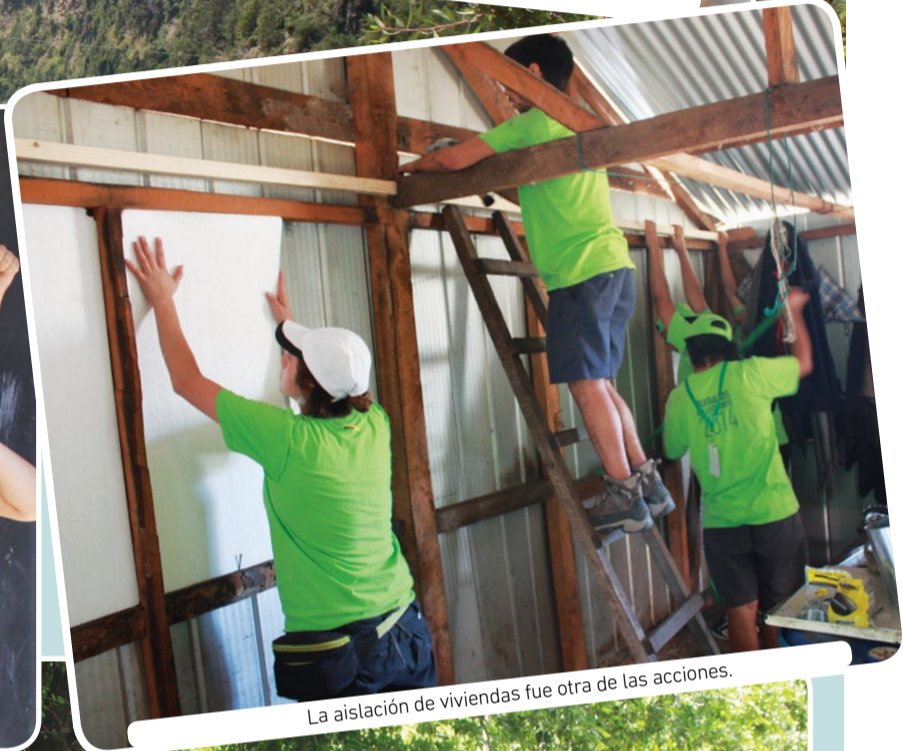
La aislación de viviendas fue otra de las acciones.