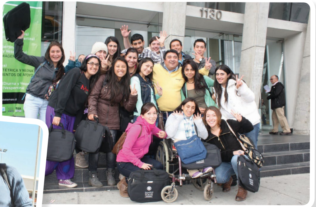
Estudiantes de Técnico Jurídico de Valdivia.