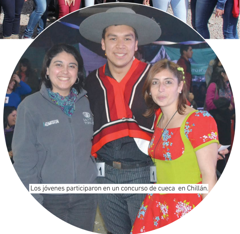
Los jóvenes participaron en un concurso de cueca en Chillán.