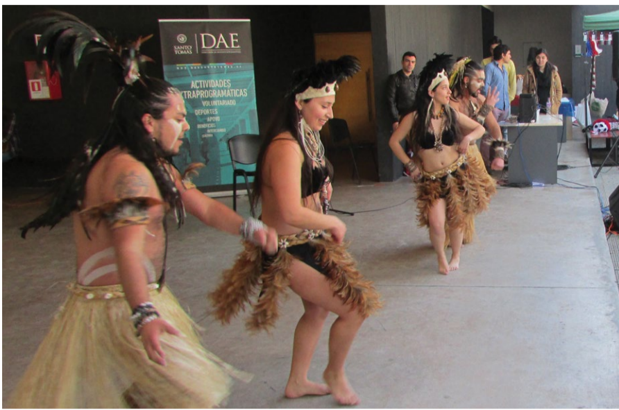
Los bailes pascuenses también se hicieron presentes en San Joaquín.