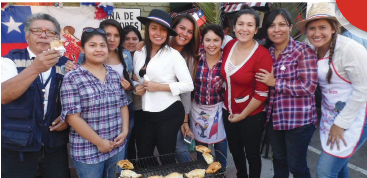
En Arica compartieron empanadas en las fondas de las carreras.