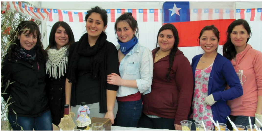
Alumnas de Temuco.