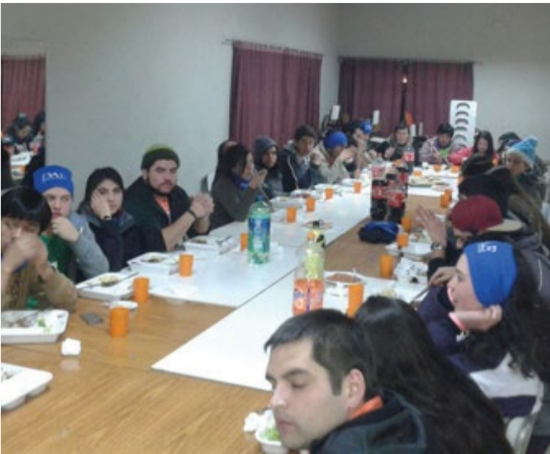
Los estudiantes compartiendo durante la cena en Mulchén.