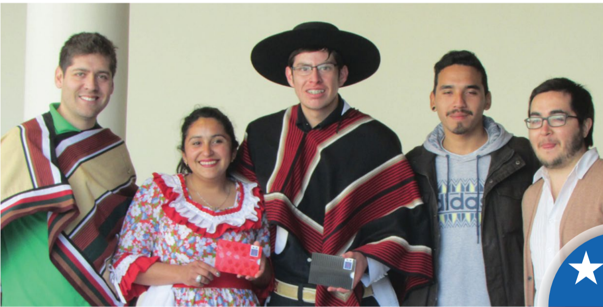
En San Joaquín, los estudiantes también participaron en concursos de cueca.