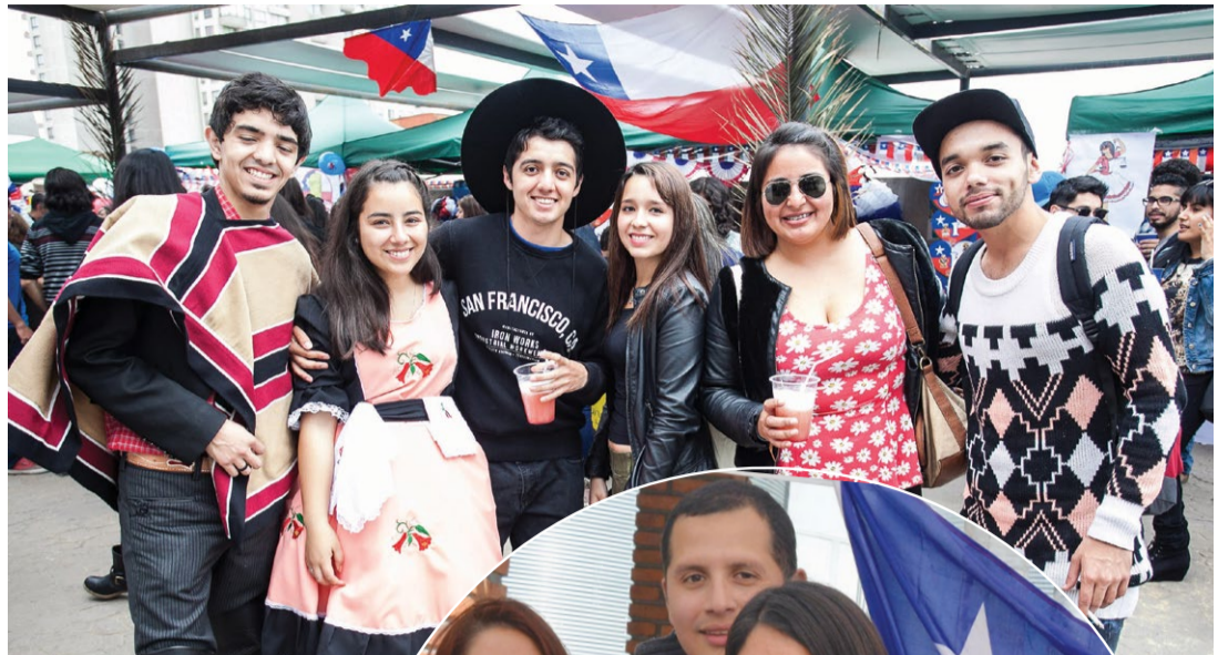
Alumnos de Antofagasta.