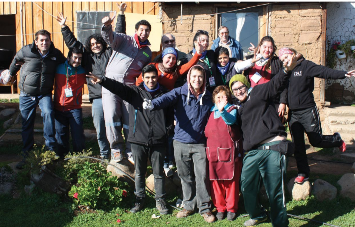
En Alhué, fueron 65 los voluntarios.