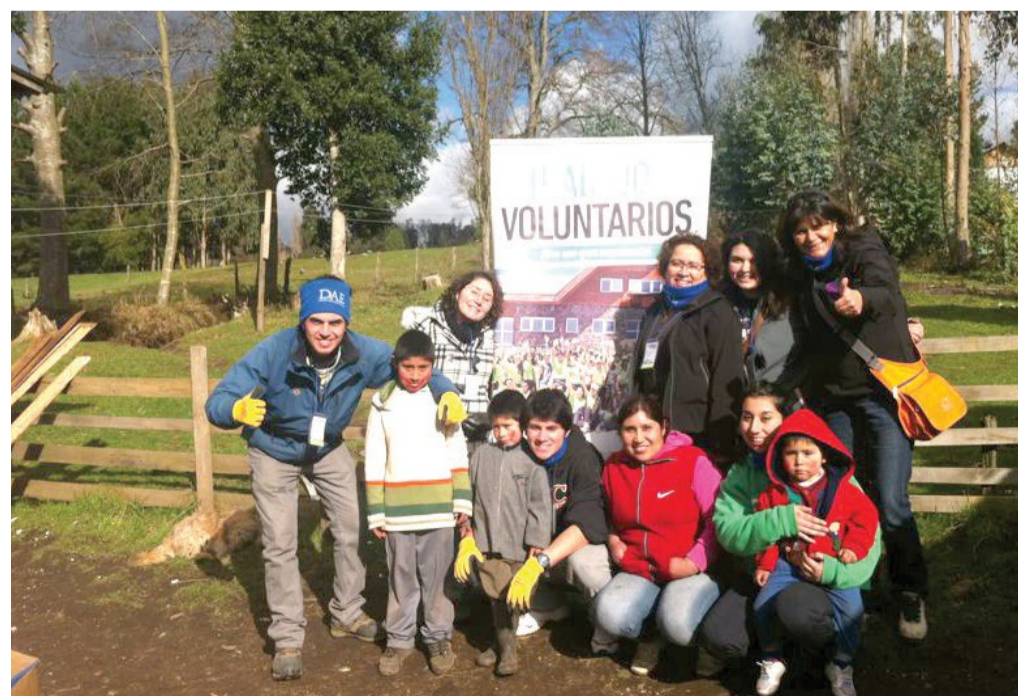
Los voluntarios compartieron con la comunidad en Lago Ranco.