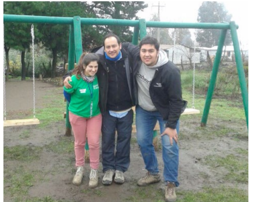
Voluntarios en Mulchén.