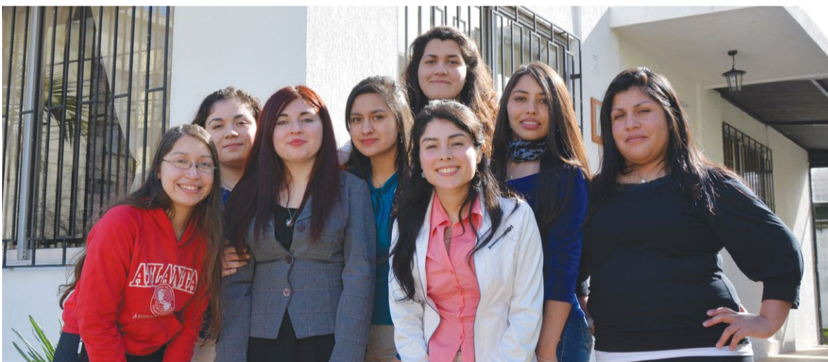
Alumnas del hogar universitario de Santo Tomás.

La residencia se suma a las de Curicó, Talca, Osorno, Temuco y Rancagua, que acogen a unos 400 estudiantes aproximadamente.