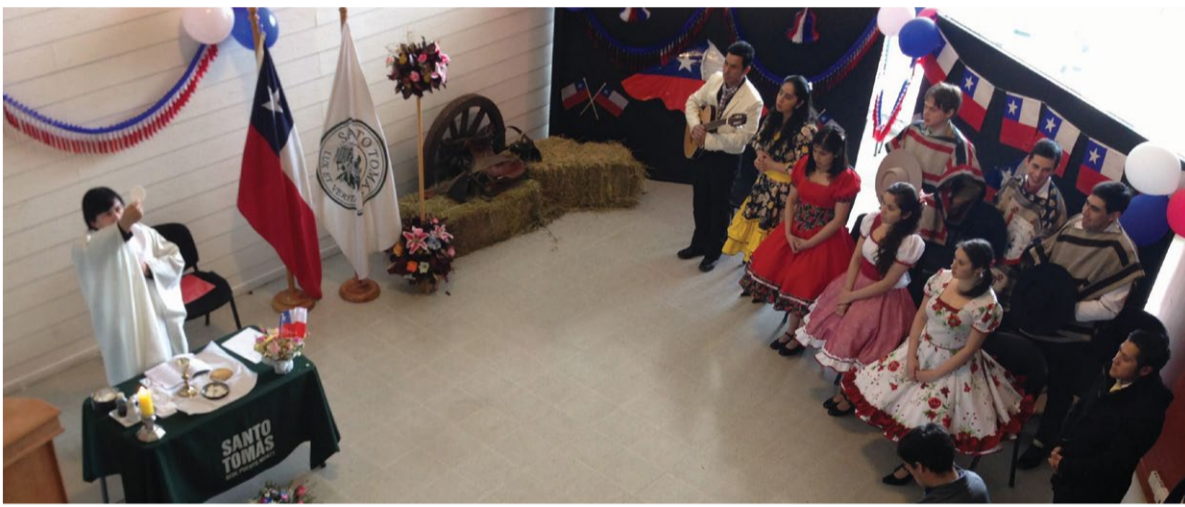
En Puerto Montt, se realizó una "misa a la chilena".