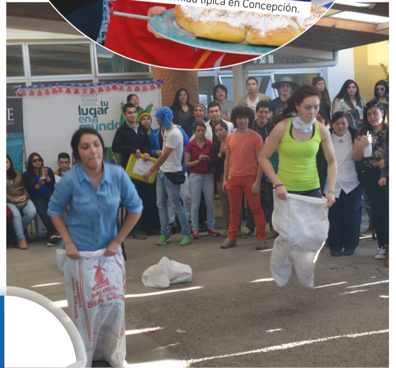
En Chillán tuvieron juegos típicos, como "carreras en saco".