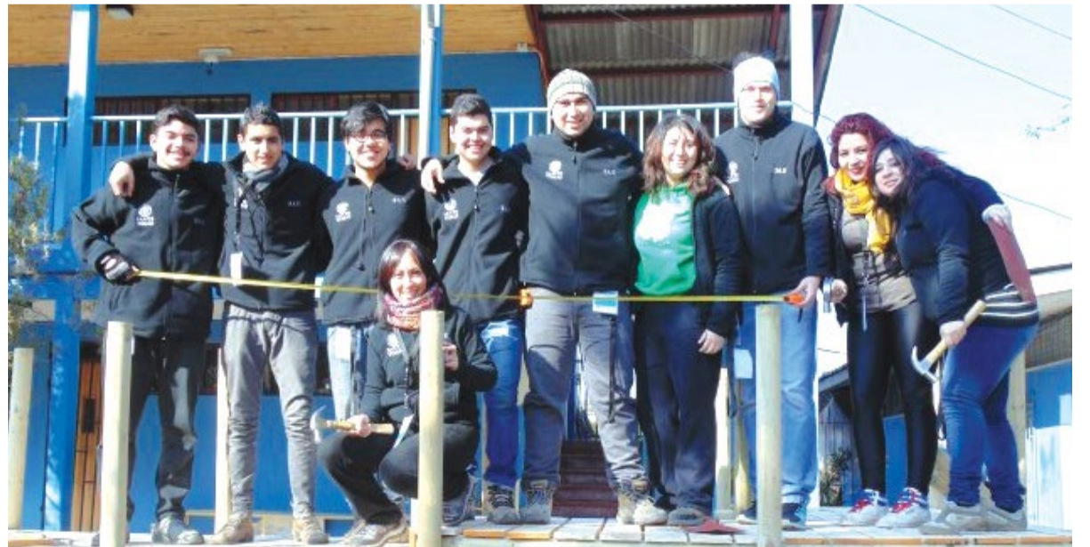
Los voluntarios en San Francisco de Mostazal.