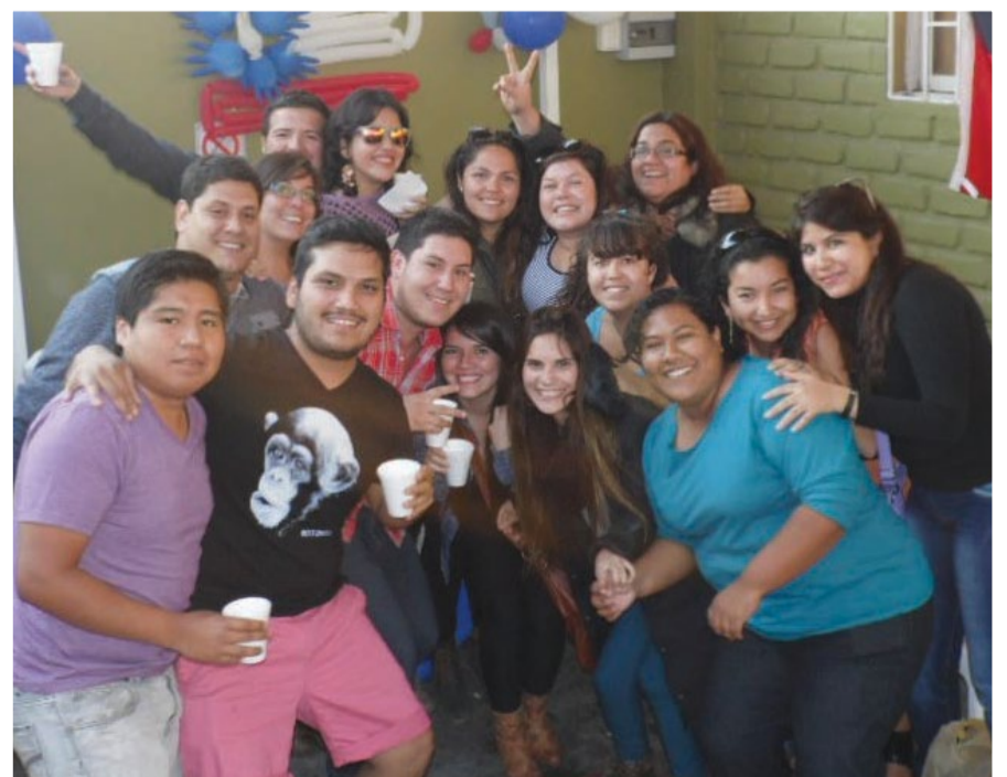
Alumnos de Arica.