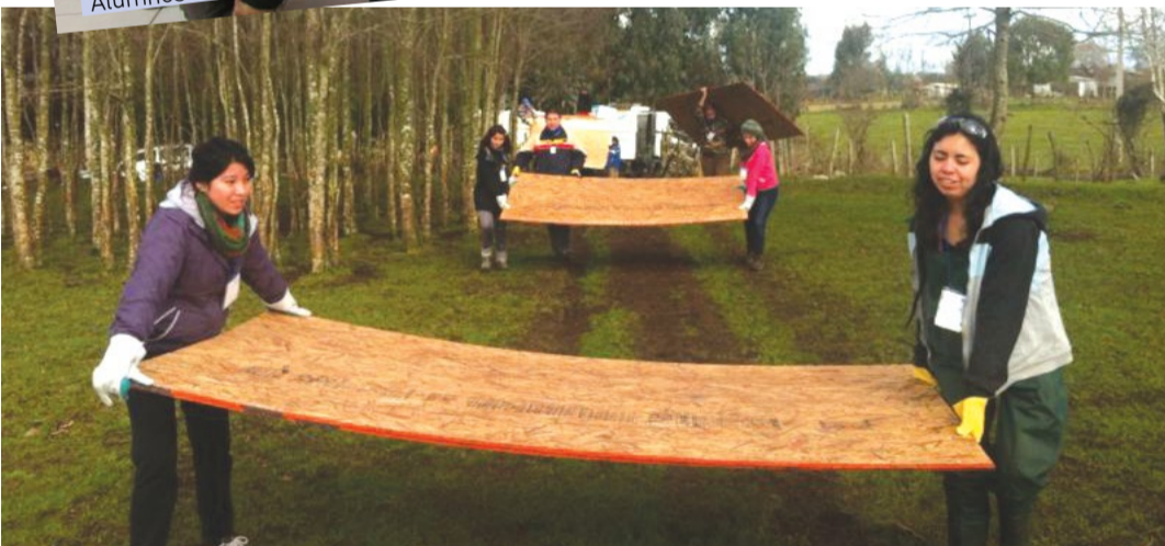
En Lago Ranco, trabajaron en la reparación de viviendas.