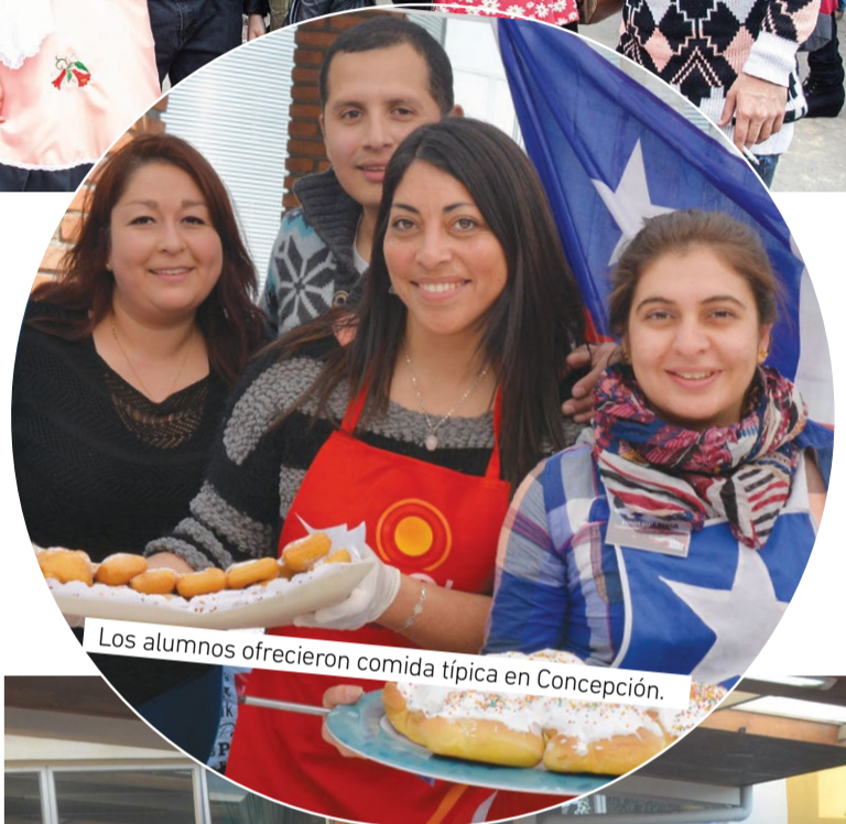
Los alumnos ofrecieron comida típica en Concepción.