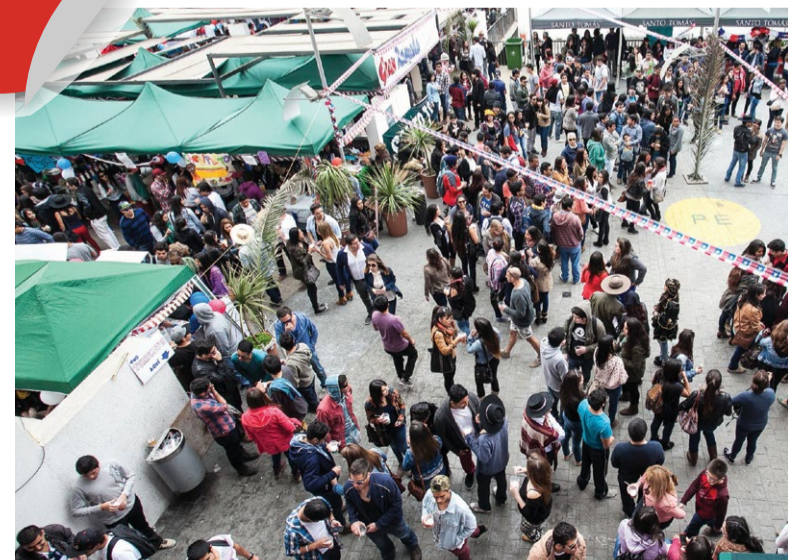
En Antofagasta los alumnos organizaron sus propias ramadas.