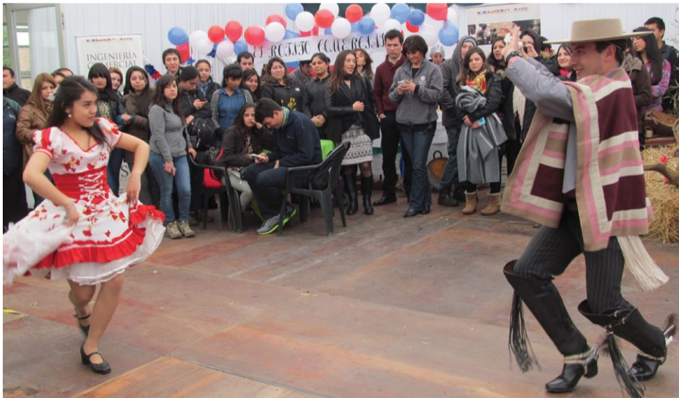
En Temuco también hubo esquinazo.