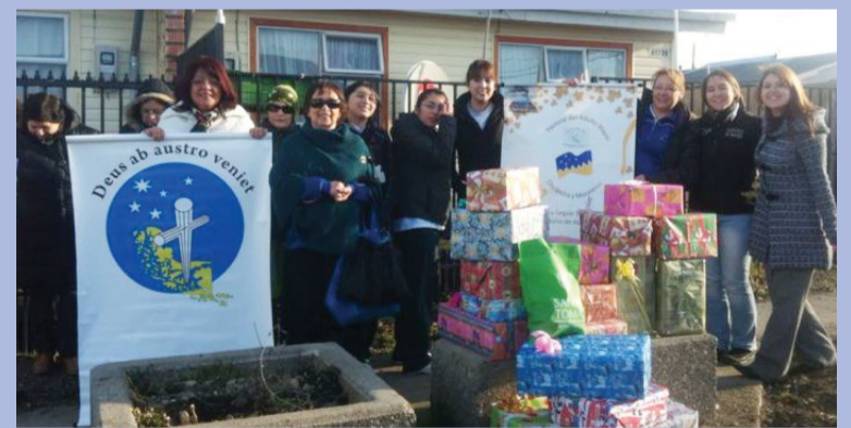
La iniciativa se realizó en la población Raúl Silva Henríquez.

La campaña se inició con la entrega de canastas familiares y un operativo podológico.