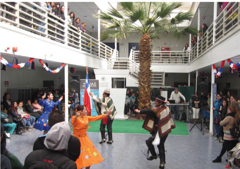
Un buen esquinazo se vivió en Puente Alto.