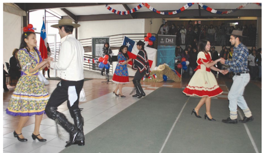
La cueca también estuvo presente en Osorno.