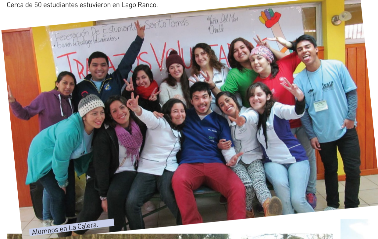
Alumnos en La Calera.