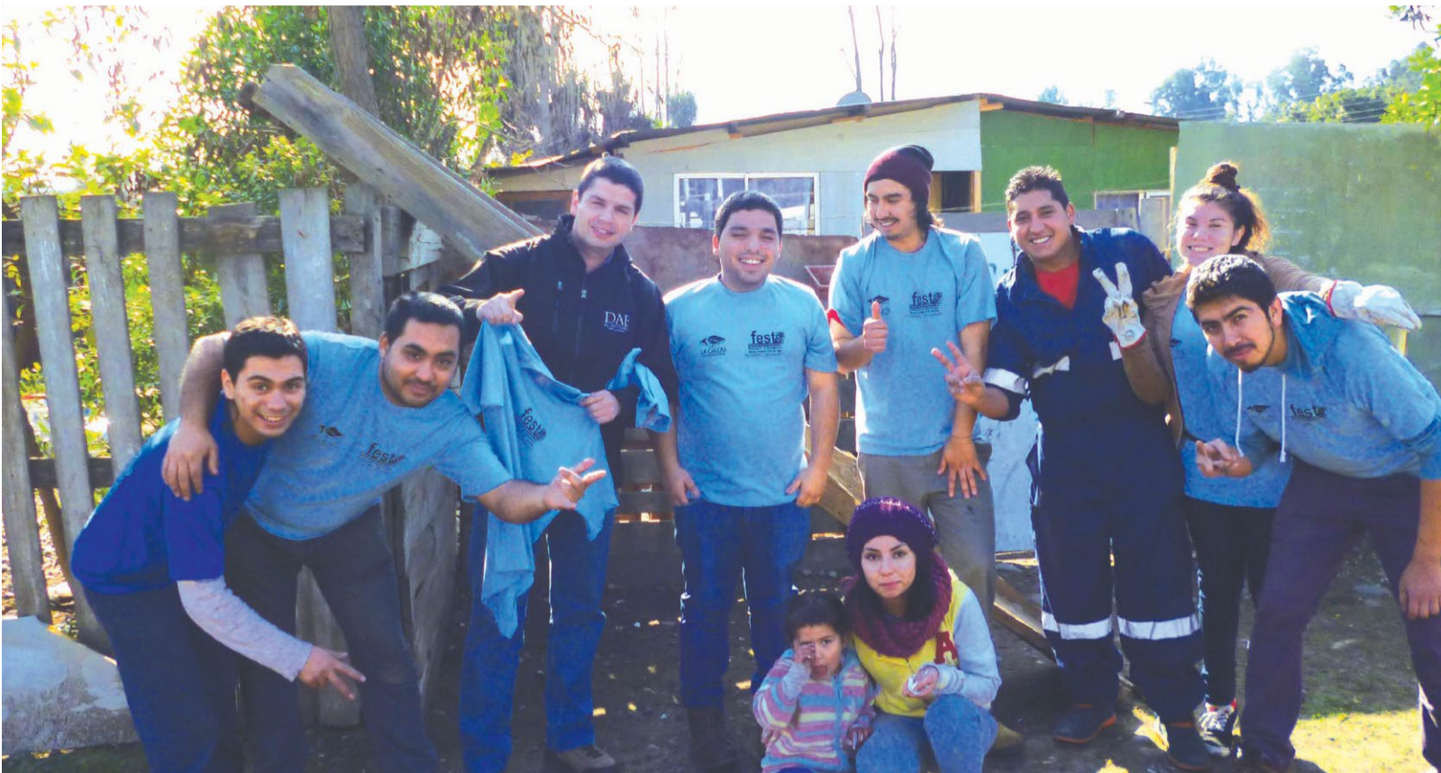
Cerca de 40 alumnos participaron de los Trabajos Voluntarios en La Calera.