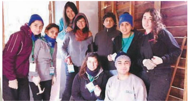
Alumnos en la localidad de Alhué.