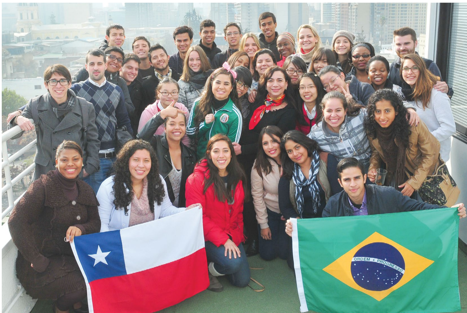
Los nuevos alumnos de intercambio de Santo Tomás.