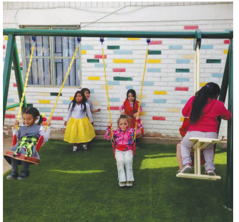
En Huara, instalaron un columpio en la escuela de la localidad.