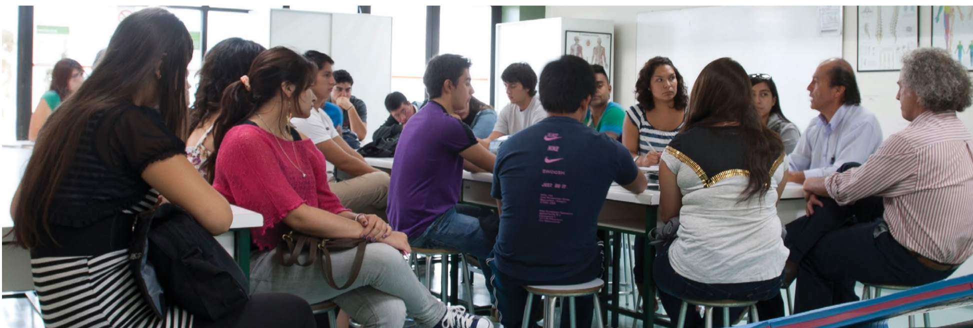
Los alumnos participan en distintas jornadas de autoevaluación.