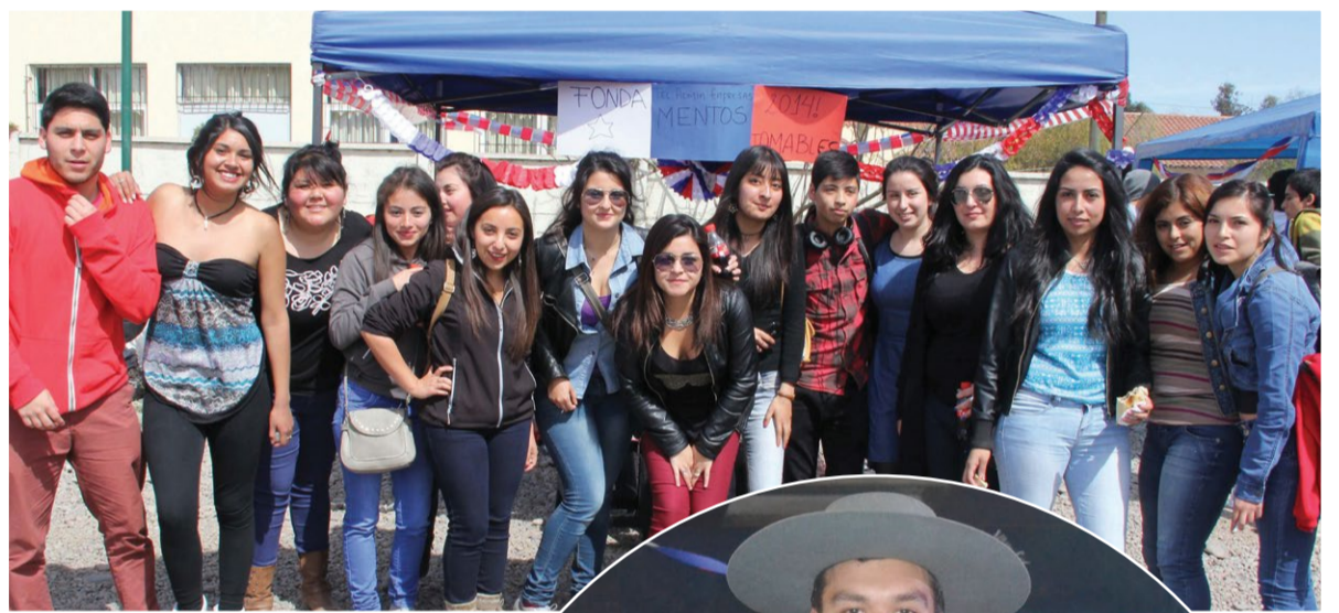
Alumnos de La Serena.