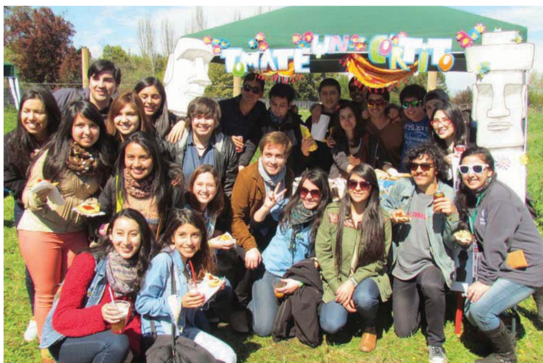
Los estudiantes compartieron en las fondas de Los Ángeles.