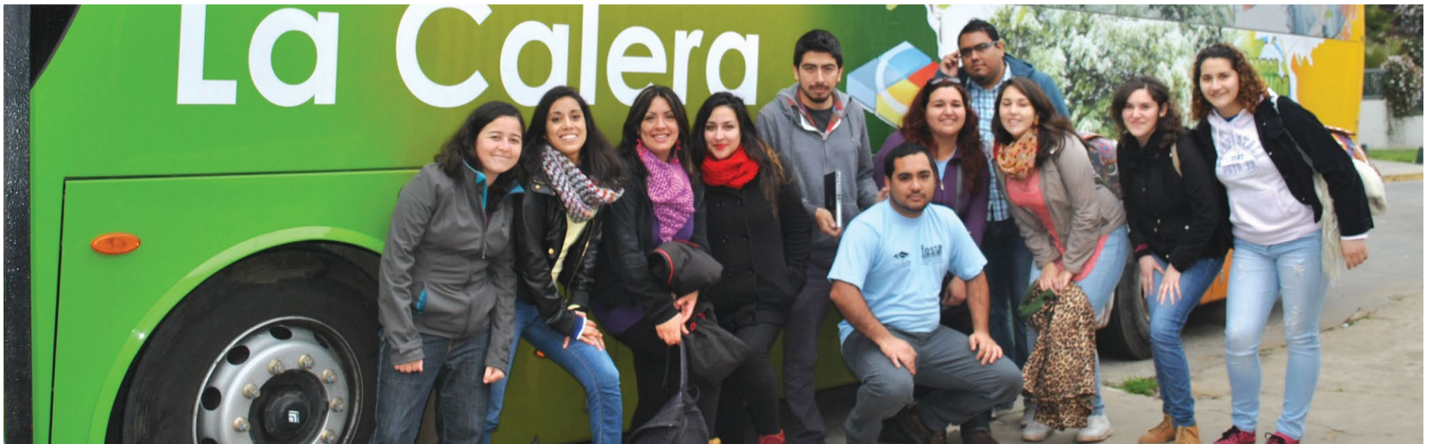
Alumnos de Viña del Mar durante su viaje a La Calera.

Los jóvenes entregaron su apoyo en Huara, La Calera, Alhué, San Francisco de Mostazal, Mulchén y Lago Ranco.