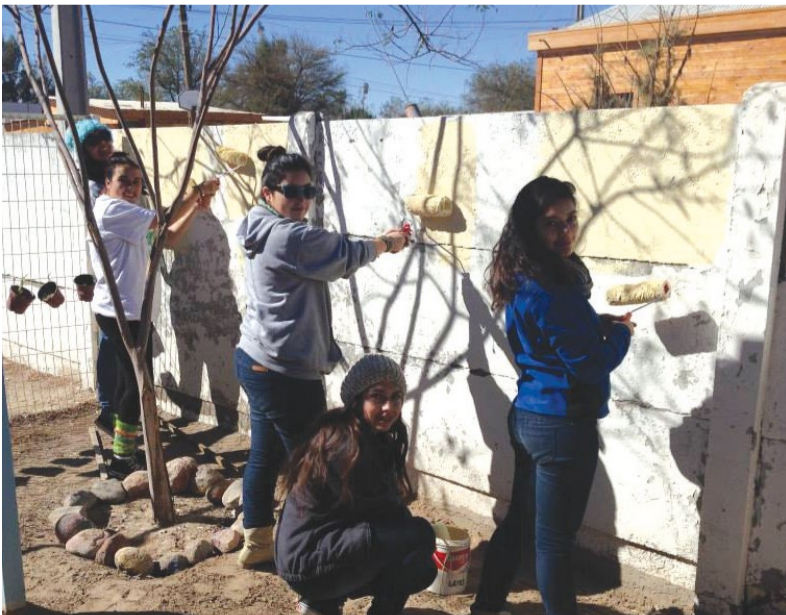
Los alumnos pintaron la escuela en Huara.