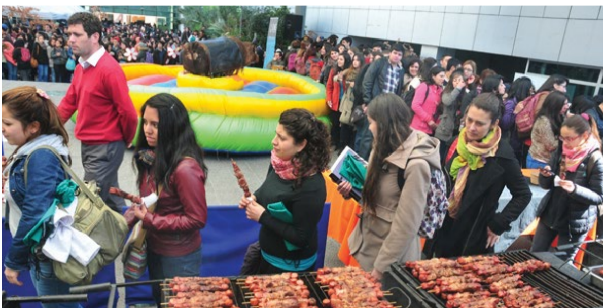
En la UST Santiago los jóvenes disfrutaron de anticuchos.