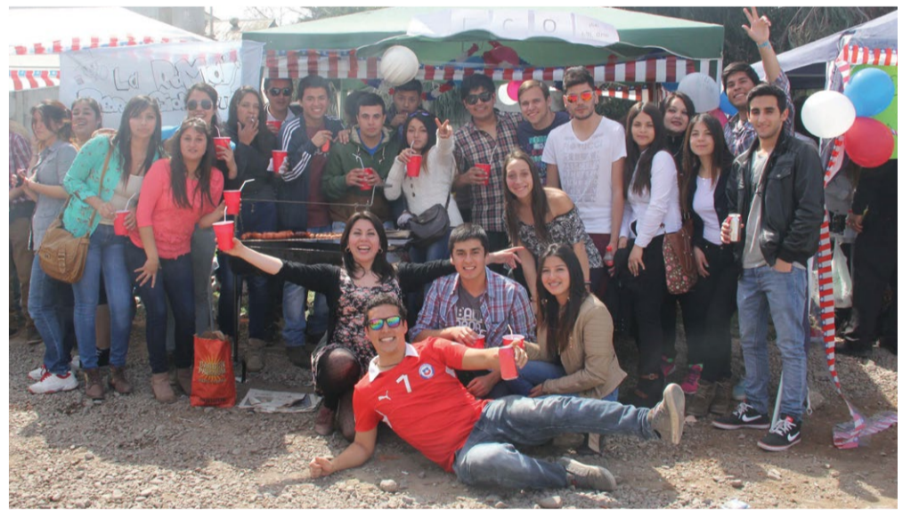
En La Serena, los jóvenes celebraron en las ramadas.