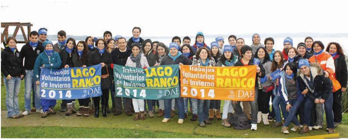
Cerca de 50 estudiantes estuvieron en Lago Ranco.