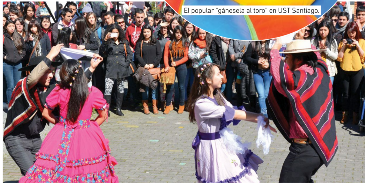
Los alumnos bailaron cueca en Concepción.

Por último, los estudiantes también participaron en distintos concursos de baile y juegos tradicionales, donde resaltaron las carreras en saco, la pesca milagrosa y el "gánesela al toro", entre otros.