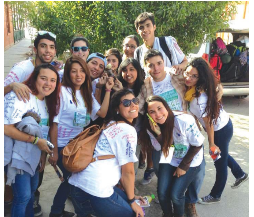
Estudiantes en Huara.

Por último, cerca de 50 jóvenes de las sedes de Temuco, Valdivia, Osorno, Puerto Montt y Punta Arenas acudieron a la zona del Lago Ranco, en la Región de Los Ríos, para reparar viviendas, preparar actividades recreativas con los niños de las escuelas y charlas sobre lenguaje de señas, alimentación saludable y prevención del alcoholismo y drogas en las comunas de Ilihue y Pitruico.