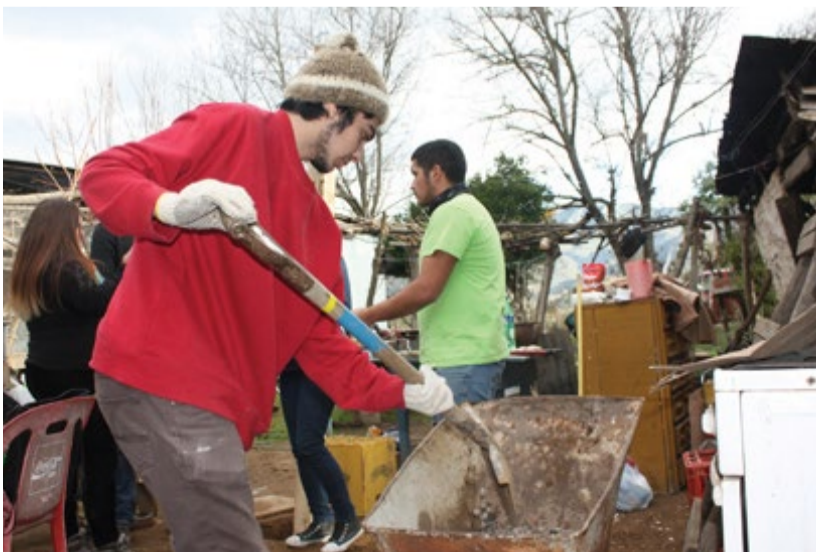
En Alhué, los jóvenes trabajaron en la limpieza de viviendas.