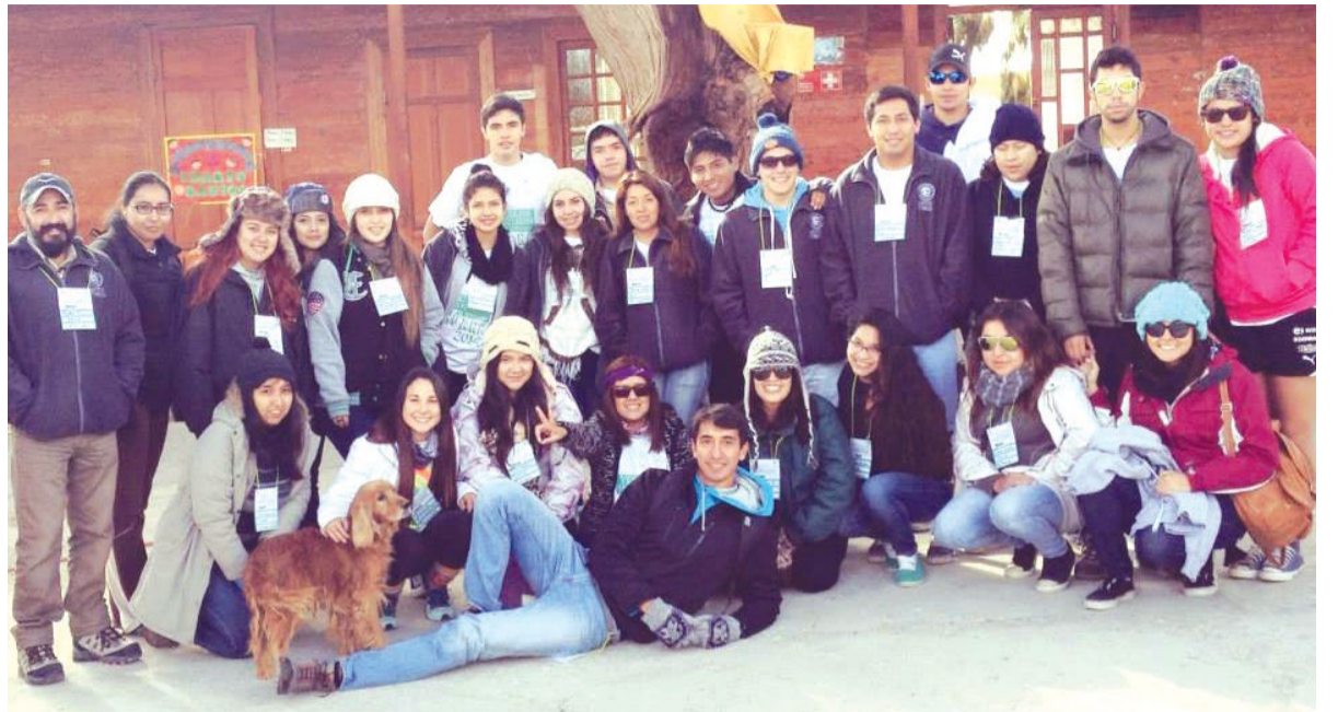
33 voluntarios llegaron hasta Huara.