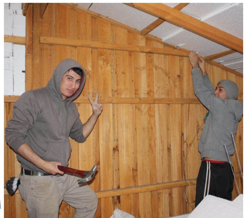
Estudiantes en Alhué.