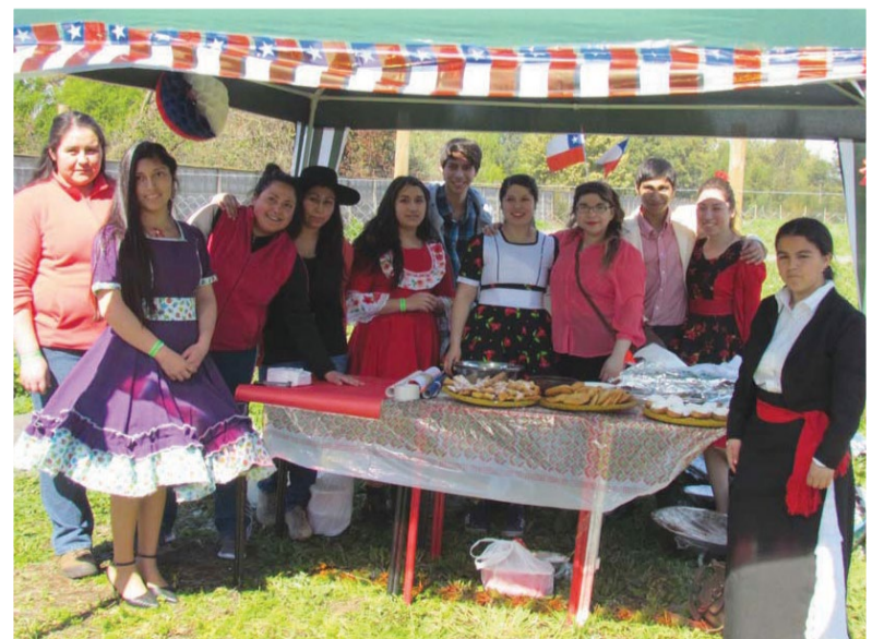
Los alumnos armaron sus ramadas en Los Ángeles.