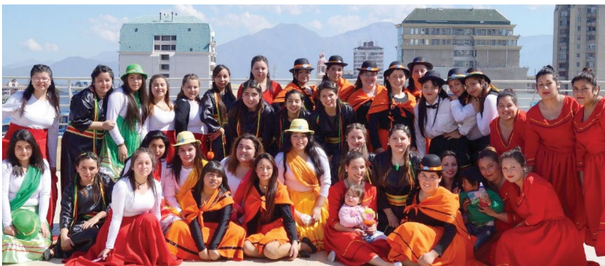
En Rancagua, la celebración contó con bailes tradicionales.